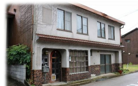
【Before】シャンソンが歌える女性の方がカフェを経営されていたそうです。