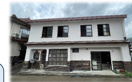
【After】移住者の方が住んでいます。今後は新たなカフェ店舗としての利用が期待されます。