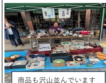
商品も沢山並んでいます

女性部は10/13（月）のゑびす講まつりに7年ぶりにフリーマーケットで出店しました。当日はお天気に恵まれ、女性部員から提供頂いた「お宝」を沢山のお客様に楽しんで買い上げ頂きました♪