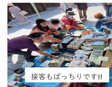
接客もばっちりです!!

来年度もSDGsへの取り組みとして開催します。商品の提供お待ちしております（^0^）／