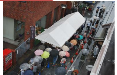
（雨の中、芋煮に並ぶ人達）