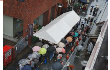
（雨の中、芋煮に並ぶ人達）