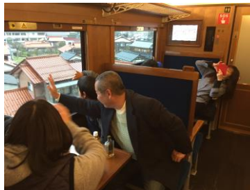
（いつもはSLに向けて手を振るけど、今回は逆の立場で）

これまでの活躍に対して親会・青年部・女性部の役員の皆様が表彰の栄誉を受けられましたのでご紹介いたします。